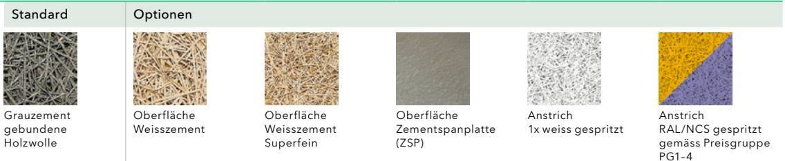
Abbildung oben: Standardversion mit Oberfläche Weisszement